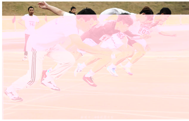
田径男子100米，是奥运会田径比赛的重要赛事之一。